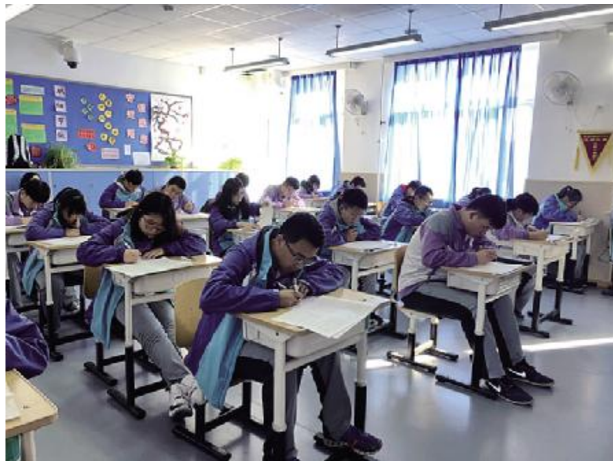
11月9日，北京理工大学附属中学高三生参加期中考试。

也在工作，它会把一天内你所看到的、听到的、学到的东西进行整理、归类、储存，消化一天所学的内容。因此，做到劳逸结合，才是时间管理的长久之计。