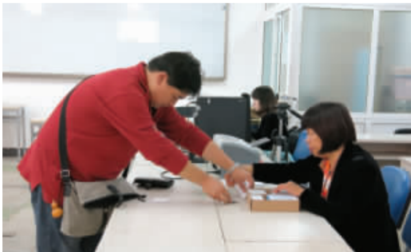
10月8日,西城区自考办内,新生正在领取准考证。

还有一位考生虽然成功登录并使用了平台,却感觉平台邮件里的内容没有考试院网站信息发布台中的多,怀疑是否是维护得不好?其实,信息少而精正是自考综合服务平台的一大亮点。因为信息发布台中发布的很多信息与考生本人无关,而自考综合服务平台只会向考生推送与其相关的信息,减少了考生检索信息的难度。新生定期查阅平台邮件,可及时获取重要信息。