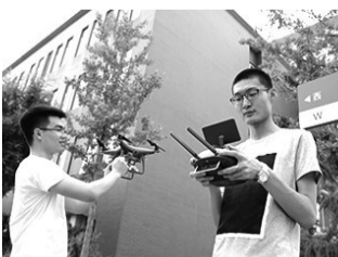
学生操作无人机航拍