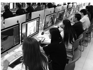
数字绘画课程课堂实景