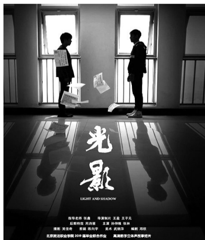
学生校园短片比赛作品《光影》