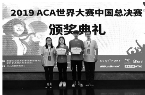
学生参加ACA世界大赛中国总决赛颁奖典礼