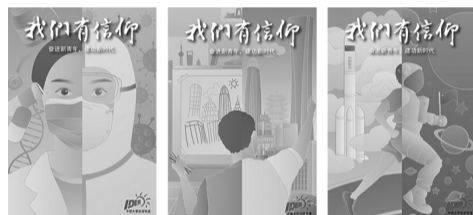
插画设计课堂习作