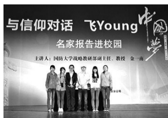
专业导师带领学生完成“飞Young中国梦”系列节目摄制