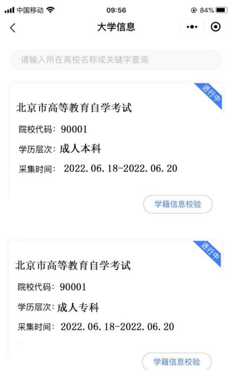
选择相应的学历层次

3. 选择相应的学历层次，进入校验信息页面，输入姓名、证件号码并授权微信联系电话。