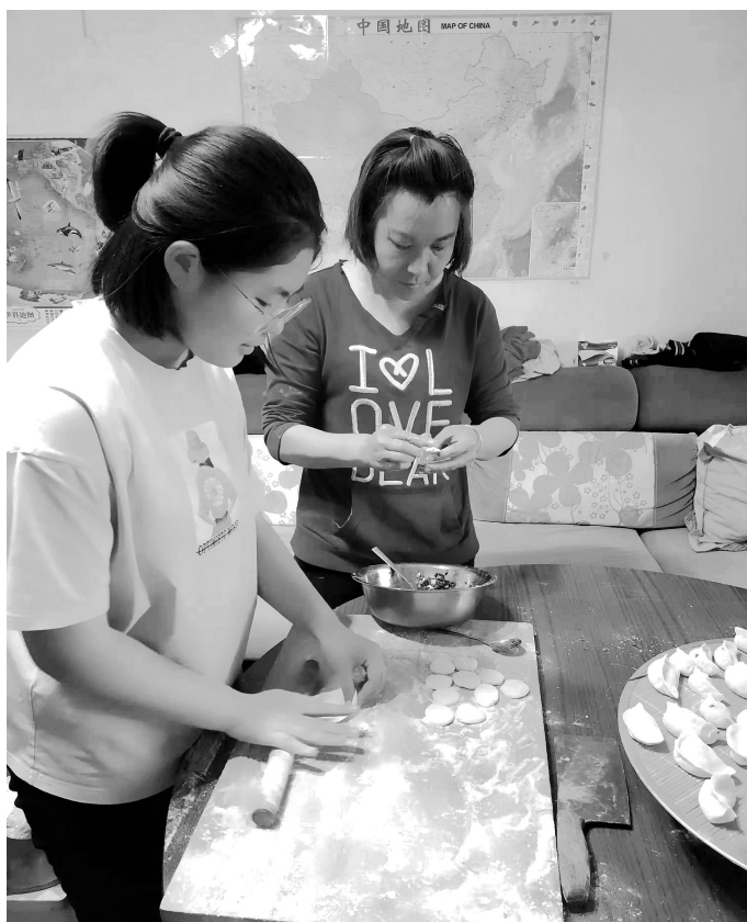
密云区第六中学学生在帮家长包饺子。