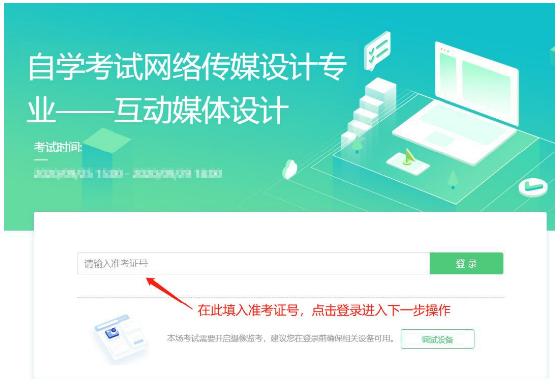
图 2 考试登录界面