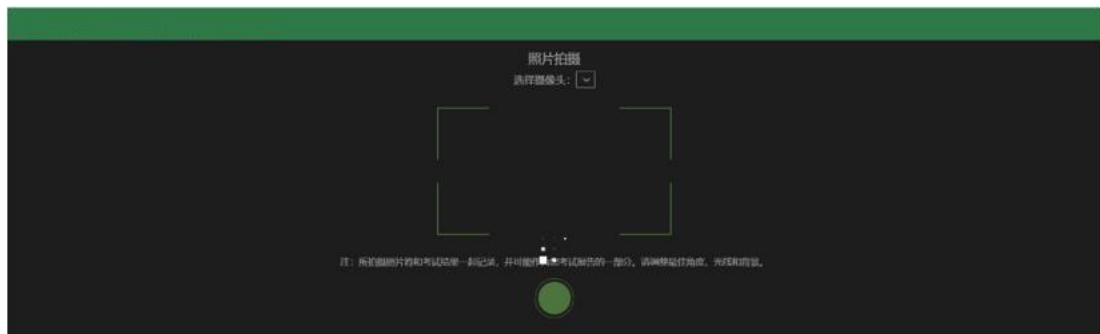
图 3 人脸认证界面