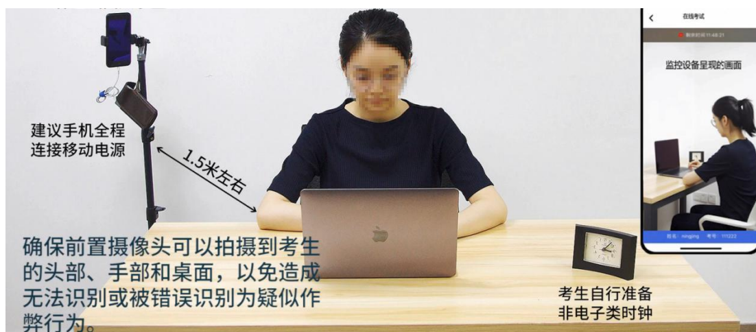
图 5 优巡设备摆放展示