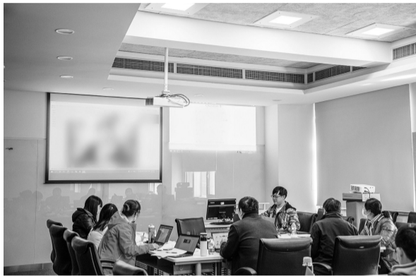
研招复试现场,复试专家组正在面试考生。