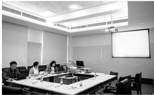
研考复试结束后,考务人员正在进行分数审核和整理工作。