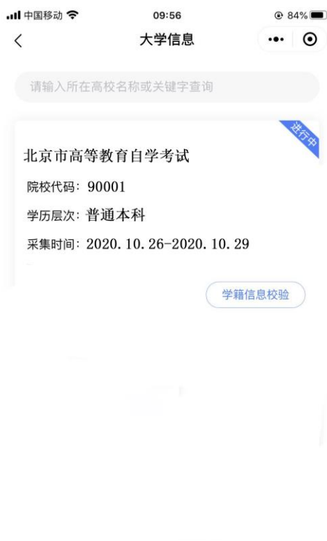
选择相应的学历层次

3. 选择相应的学历层次，进入校验信息页面，输入姓名、证件号码并授权微信联系电话