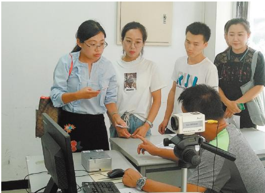
自考生可通过北京教育考试院网站、《北京考试报》等了解自考试讯。如有疑问要及时向市、区自考办询问。图为自考新生在向区自考办老师咨询。

考生只能选择以上一种办法办理免考。同一门课程不得重复使用。管理段证书共同课的免考手续要在申报前办理完毕。如考生的毕业证或本科段专业课程合格成绩可在北京自考系统(zikao.bjeea.cn)中查询到,则由系统为考生自动办理免考手续。