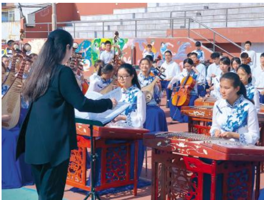
8月31日,北京市第十九中学的开学典礼恰逢学校金帆民乐团成立30周年,图为学校金帆民乐团现场为全校师生演奏。

“刚才入场时,每名同学都抽取了1张卡片,卡片有图片及相应的名称。比如我手里的这张,图案是唢呐,请大家关注自己卡片上图案的内容,有3种图案是今天的惊喜卡。”开学典礼上,主持人提醒大家。经过一个暑假的修整、充电,8月31日,十九中的2000余名学生再次迈入校门,开启新学年。与往日不同的是,在他们迈入操场大门时,每人都收到了一张“神秘卡片”,上面绘有民乐乐器、书法作品、京昆人物等35种不同的图案。其中3种图案为他们的新学年埋下惊喜的伏笔。“卡片上行书的内容是‘学如弓弩,才如箭簇’的同学,恭喜你们获得‘喜上眉梢奖’,在未来一学年,你们可以任选某一天的某一学科自主安排作业,免做或者少做。”海淀