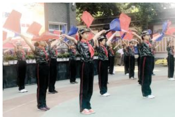
前门外国语学校开学典礼上,初一新生表演旗语操。