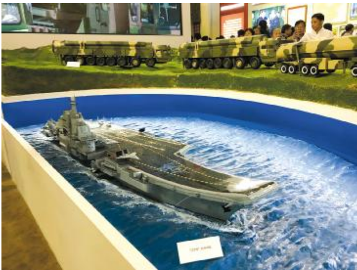
图为“辽宁号”航空母舰模型。