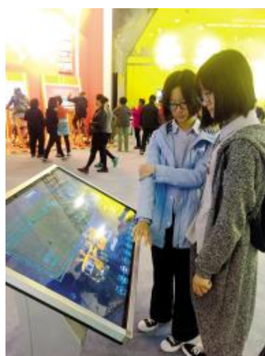
10月25日,北京林业大学城乡规划专业学生在工作人员的讲解下了解大数据信息。