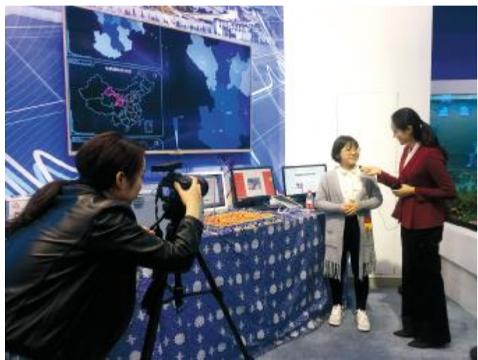
10月25日,中国传媒大学国际新闻专业学生在北京展览馆内拍摄视频,完成作业。