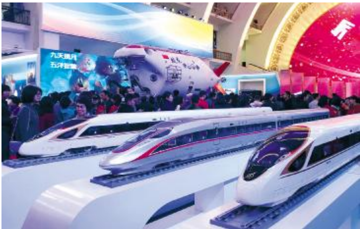
图为“蛟龙号”载人深潜器模型和“复兴号”动车组列车模型。动车组整体设计以及车体、转向架、牵引、制动等关键技术都是我国自主研发,具有完全自主知识产权。