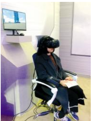
10月25日,北京理工大学计算机专业学生参与长征二号F运载火箭发射场组装VR体验,感受了从火箭装载到发射的过程。