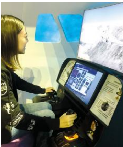
10月25日,北京航空航天大学通信专业学生体验基于北斗导航的飞行校验系统。