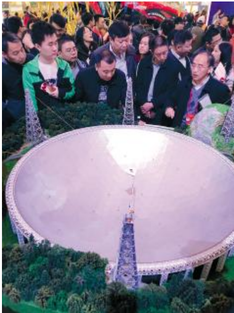
图为被誉为“中国天眼”的世界最大单口径球面射电望远镜模型。